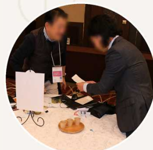
個別商談（事前申込）