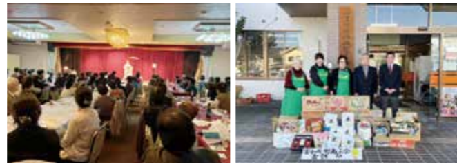
秋の富士川コンサート

四つ目は、「フードドライブ」事業です。この事業も、コロナ禍に始めたもので、女性部員から提供いただいた食材637個(重量にし