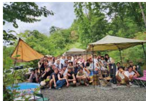
スタッフ勢ぞろいのパーベQ

これからは若い人たちのカラーで、新しい甲州市商工会女性部を作り上げていって欲しいと願っています。