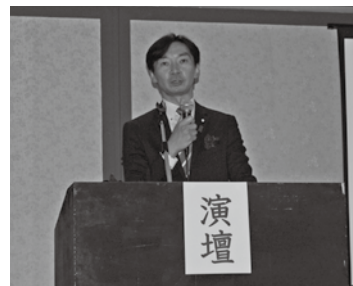
宮本周司参議院議員による講演

県青連総会終了後には、「これからの商工会青年部」と題して、全国商工会連合会及び全国商工会青年部連合会の顧問であり、商工会の組織内議員である宮本周司参議院議員による講演が行われた。