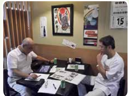
専門家による巡回訪問