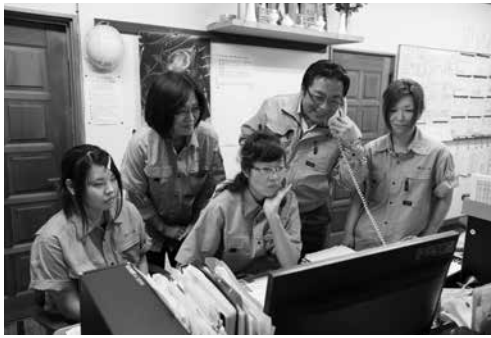
社員一丸となって顧客のニーズに対応

同社は、トラックや建設機械の部品等を製造している精密板金加工会社である。平成十四年、社長が工場長として