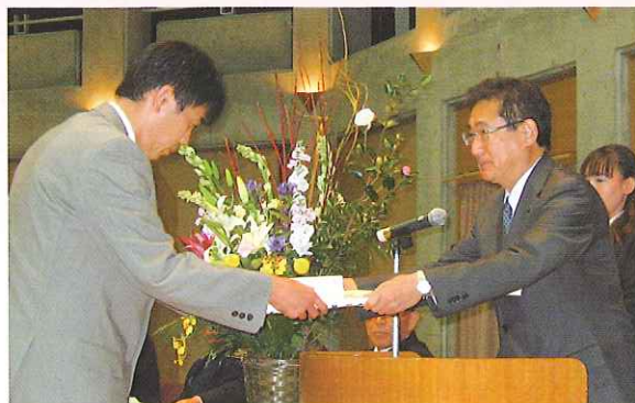
永年にわたり、優良従業員として企業に貢献されたみなさんには、勤続年数に応じて、表彰状と記念品が贈られました。