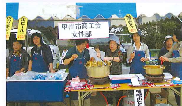
テントの前は販売開始から、大会に参加した大勢のランナーで賑わいました。