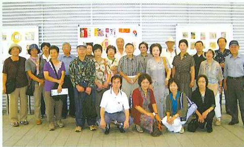
視察研修に参加し、交流を深めました。

商業部会は9月4日に埼玉県の鉄道博物館と菓子屋横丁を、また工業部会は9月7日・8日に福島県で廃油のリサイクル事業に取り組んでいるトラスト企画を視察研修しました。 尚、サービズ部会には各専門部を業種ごとに商業関連・工業関連に分け、それぞれの研修を合同開催として参加しました。