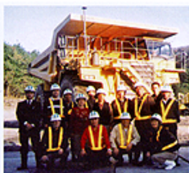
コマツ・テクノセンタを視察。 (工業部会)