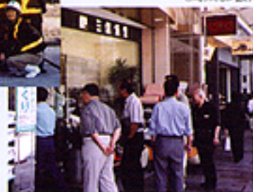
呉服町名店街を視察。 (商業部会)

商業部会は9月3日に「一店逸品運動」で有名な静岡県静岡市の呉服町名店街を、また工業部会は11月12日・13日に静岡県伊豆市にある大型建設機械の試乗体験などができるコマツ・テクノセンタを視察研修しました。 尚、サービス業部会は各専門部を業種ごとに商業関連・工業関連に分け、それぞれの研修に参加しました。 研修会を通して会員相互の交流と親睦も図られました。