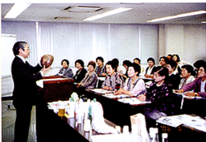
長谷川部長から説明を聞く女性部員

今年の女性部視察研修会は六月九日横浜の太陽油脂(株)を視察訪問し、人にも地球環境にも優しい製品づくりについて研修した。