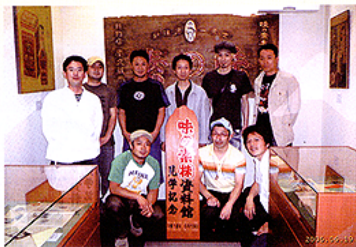
研修に参加した青年部員

今回の研修会をとおして、塩山と勝沼大和の青年部員間の交流を図り、親睦をさらに深める機会としても有意義な研修会となった。