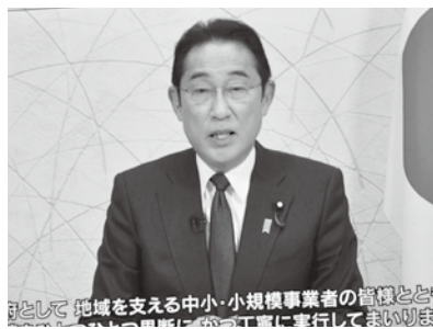
岸田総理大臣からのビデオメッセージ