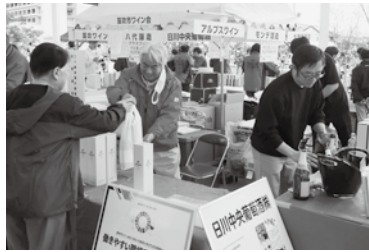
ワイナリーが直接販売。ファンにとってたまらない一瞬

「笛吹市のさまざまなワインとそれに合った美味しい料理を楽しむことができました。旅先で地元のイベントに参加できて、通常の観光よりも楽しかったです。」(台湾40代女性)と甲州ワインビートの調和に感動。サタデーナイトワインバルでは、無料で今年のヌーボーがふるまわれ、楽しいひとときを過ごした。第2回フキヌーボーフェスタは、山梨の観光資源を最大限に活用し、地域経済の回復と訪日客数の増加に貢献する重要なイベントとなった。