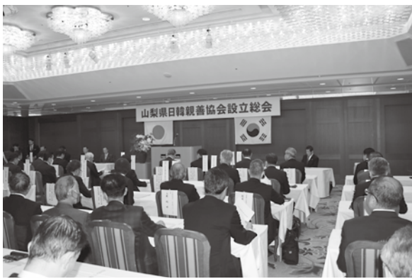
多くの関係者が出席

本協会の設立経緯は、山梨県が、韓国・忠清北道と平成4年に姉妹締結を結び、これまで30年以上に渡り、経済、観光、青少年、スポーツ等様々な分野で交流を重ね、日本と韓