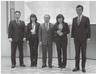
全国連森会長から表彰を受けた都留市商工会

職員が対象で、なかでも都留市商工会が「生命」純増部門で全国一位となり、表彰を受けた。研修では、他県商工会の推進事例などの発表の他に懇親会も開催され、活発な意見交換が行われるなかで、共済推進に理解を深めていった。