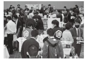
約200名の来場者で賑わった

ペースで提供された個別相談の場では、希望した事業者が専門家と面談し、自社商品のPR方法や新たな販路開拓の手段等アイデアを仕入側からならではの視点でアドバイスを受けた。今年も県内の大学・高校も出店し、生徒自らが開発した商品をバイヤーに紹介。商品やPR方法についてアドバイスを受けたり、他出展者の商品や出店方法等を参考にするなど、生徒の良い経験になった。