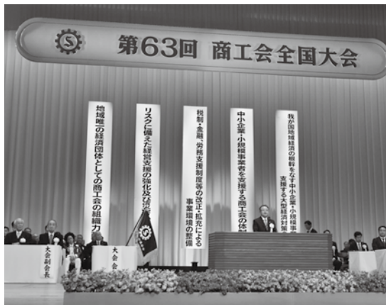
商工会の方向を示す決議

いる。 当日は、開催を祝う岸田総理や西村経済産業大臣からのビデオメッセージのほか、武村農林水産副大臣や日本政策