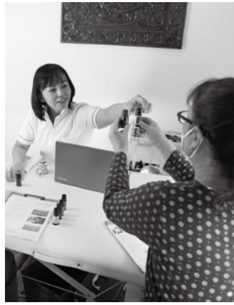
アロマスプレー手作り体験 (美希の部屋)

甲州市商工会主催の「甲州まちゼミ」が今年で4回目の開催を迎え、地域の商工業者と市民をつなげ、地域活性化を促進している。今年度は、10月1日