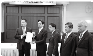
長崎知事に要望書を手渡す4団体代表

長崎知事は「コロナ対策では商工会に多大な協力をいただいた」とした上で、「県経済の発展につながるよう、積極的に取り組んでいきたい」と述べた。