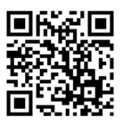
Chat GPT インストール