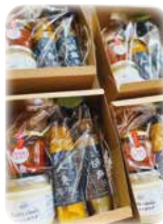
オリジナルギフト

一番の特徴は、お店で販売している食材や調味料を使っていることです。ランチタイム以外は地元の銘菓をオリジナル珈琲や紅茶と共に味わ