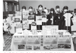
実践的な学びを通じた起業家精神の育成

商工会は11月8日、会員事業所と県内外の卸・小売の仕入担当者の繋がりをつなぐ「農商工連携マッチングフェア」を甲府記念日ホテルで開催。今年も80事業所が申込み、参加した200名にぜひまる卸売業やスーパー・百貨店、またネットショップを運営するバイヤー等に自社の商品をPRし、商機を広げる場となった。