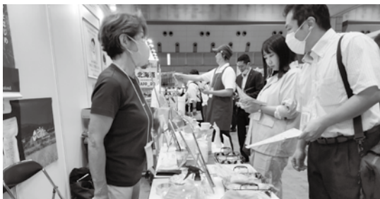
出展者は新たな販路開拓につながった

都留市商工会は、地域経済の発展を支える重要な存在として、経営者たちの成功を応援し続けている。