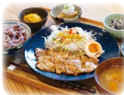
人気の月替わり定食

食堂では対面 10 人の 1 枚板テーブルと景色を眺められる窓向きのカウンターで、旬野菜をたっぷり使った定食やお弁当を提供。