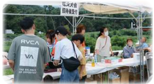
花火大会の受付では山梨市商工会職員の皆で参加者に対応

新たな需要と環境に対応しなければならない困難な状況に立ち向かう事業者のため、商工会は会員とのコミュニティの絆を深め、協力し合いながら、新しい日常を築いていくことが求められる。