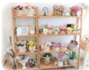
店内はフラワーでいっぱい