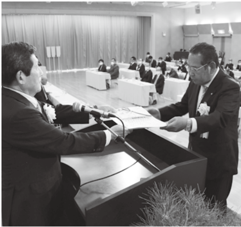
長から表彰状を授与された。