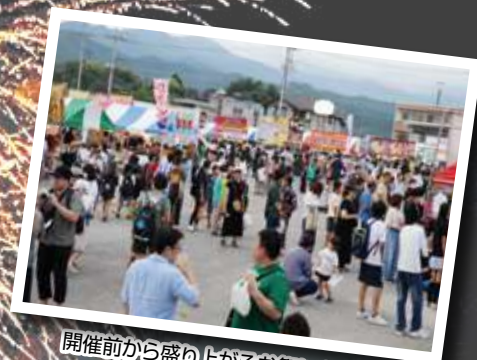
開催前から盛り上がるお祭り広場

地域に愛されるお祭りが再開されるにはどんな苦労があったのか、また昔とは何が違うのか、山梨市商工会の取り組みを紹介したい。