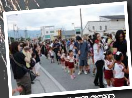
花火前の盆踊りを楽しむ参加者