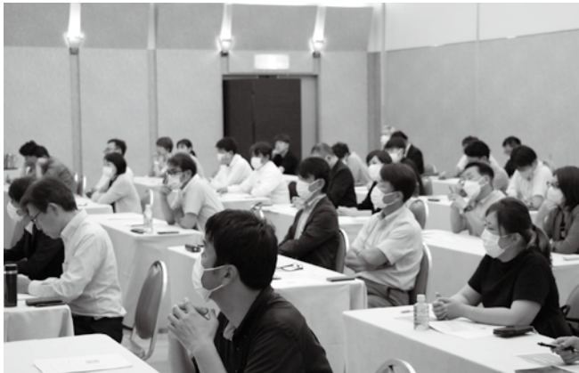
2つの会場で真剣にDXを学ぶ参加者