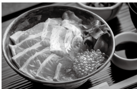
好評の富士の介丼

の確保を模索し、出会ったのが山梨県のオリジナルブランドの養殖魚「富士の介」だった。2019年に初出荷されたばかりで認知度は低かったものの、富士の介をふんだんに使った「富士の介丼」は県内外の方から好評だった。しかし、定期的に感染拡大するコロナウイルスの影響により、どんなに美味しいものを提供できていても人が来ない悔しさがあつたと当時を振り返る。