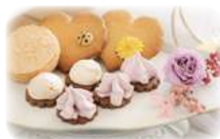
美味しそうな焼菓子