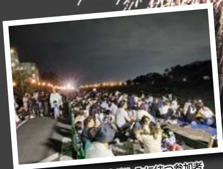
花火大会の開始を楽しみに待つ参加者