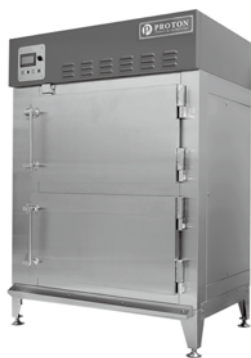
凍結機を導入し新しい挑戦に踏み出した

そうした経営課題を商工会の青年部担当者へ相談、定期相談会や専門家派遣などを通じて事業計画書を策定し、事業再構築補助金へ挑戦したところ、見事採択されプロトン凍結機の導入が実現した。採択後も資金調達のみならず交付申請・実績報告といった膨大な書類申請についても、商工会担当者から手厚いサポートを受けることが出来た。さらに「富士の介」を加工した商品についても、県内外の展示会へ出展させてもらったことや、商品のブラッシュアップなどの定期的なフォローアップもあり、現在、県内外の業者へ販売出来ているという。