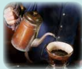
創業以来使われているポットでドリッピングするコーヒー

創業当時から3代に渡り使われているポットで淹れたコーヒーと特別な空間でいただく食事は、まるで実家に帰ったような居心地の良さを感じさせます。笛吹市に来た際は「WEST MOUNTAIN」に足を運んでみてください。(調査員 S&O)