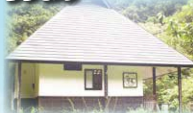
山の中の小さな癒しどころ