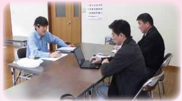
伴走支援による経営相談の様子

※ ESG = 環境 (Environment)、社会 (Social)、ガバナンス (Governance) の頭文字。各分野に配慮し企業の持続的な成長に繋げる経営スタイルのこと。