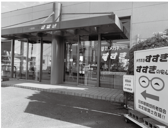
昭和バイパス沿いの「すすき」