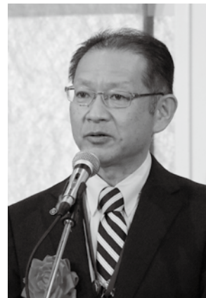
祝辞を述べる長田公山梨県副知事

5名が祝辞を述べられ、地域経済の持続的な発展に向けて、商工会に期待する言葉が寄せられた。