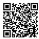
八ヶ岳シフォン工房 月のひるね

販売者から一言：一度食べた忘れられない程しっとりふわっふわっ♡ 八ヶ岳シフォンは北杜市の新スイーツです。地元の素材を取り入れながら種類は80種以上！届く種類はお楽しみ♡贈答にもどうぞ