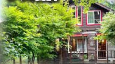
森の中、たった一軒の本屋