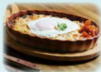
焼きカレー・目玉焼きトッピング

イチオシメニューはリニューアルオープンから愛され続けているカレーを使用した「焼きカレー」。カレーライスの