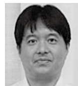
(昭和町商工会・山口指導員)

厳しい経営環境の中で事業の引継ぎを決めるには相当な覚悟がある、前向きに取り組んでいる事業者の想いを理解し、これからも寄り添った支援をしていきたい。事業承継は準備が大切です。身近な商工会に是非一度ご相談ください。