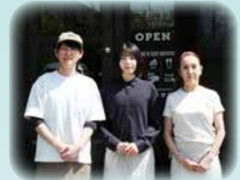
左から：哲平さん（現代表）、哲平さんの奥様、お母様