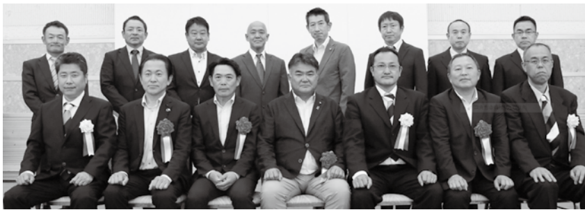
基調講演会講師2名と壮青年部員