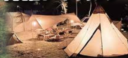
道志川沿い自然豊かな景色