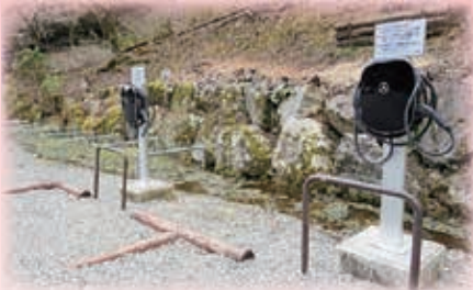
船山温泉 EV 充電器

担当者は、「魅力ある商工業者を行政と連携しながら積極的に支援していくことで、地域全体の商工業の底上げを図り、ひいては地域イノベーションの創出に繋がっていきたい」と語る。