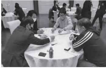
若手リーダー研修の様子