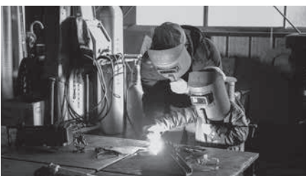
次世代商工業者の育成にもつながる

県内でも有数の「ものづくりのまち」 韮崎市。韮崎市商工会では普段入ることのできない市内の工場に潜入できる特別なイベント「ニラサキオープンファクトリー2023」を令和5年1月20日、21日の2日間で開催し、延べ約250名が参加した。見学や体験を通じて沢山の人の「ものづくりの魅力」を知ってもらうため、各工場では最新設備の実演や製造工程の見学、はんだ付けや溶接の体験を企画し、子供も大人も目を輝かせながら「ものづくり体験」を満喫した。参加者からは、「知らない世界を体験できて子供の良い経験になった」「将来、この会社で働きたい！」などの声があり、商工会としては、「産業人材育成」に繋がる取り組みとして引き続き取り組んでいくこととしている。