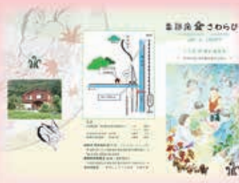
南部窯早蕨 リーフレット