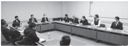
視察研修・意見交換会の様子