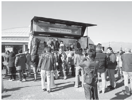
▲震災から一年。忘れてはいけない思いをトラックが運ぶ。

東日本大震災の復興支援の一環として全国商工会連合会が実施している「復興応援トラックマーケット」が二月十二日中央市の「道の駅とよとみ」で開かれた。トラックはONE HEART号と名付けられ「One Heart Now(今ここをひとつに)」をテーマに全国二十一個所を回り東北支援を呼び掛けた。荷台部分は、東北地域の商工会会員の加工食品などで満杯。東北を応援しようと大勢のお客様