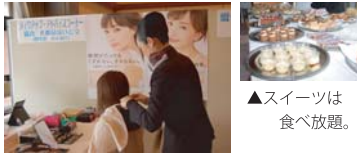
▲プロがアドバイスする特設ブースは大盛況。列が途切れることがなかった。