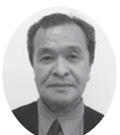
辻 薫 管轄 (甲斐市)